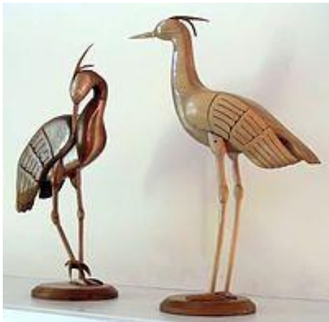
الشكل رقم ( 3.2 ) : مثال على نحت الخشب - من انواع الفنون التطبيقية .