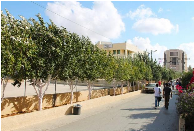
الشكل رقم (4.2) : صورة توضح جامعة بوليتكنك فلسطين ( كلية الهندسة )